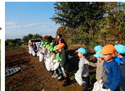
軍手をつけて芋の掘り方の説明を聞く