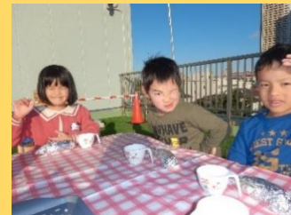
屋上で焼き芋パーティー