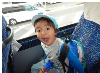
リュックをしょって元気に出発！ 楽しい車中