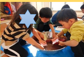
ペーパーやアルミホイルで包む