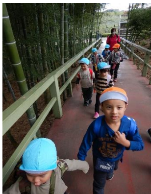
たくさんの動物を見て… 次は何かな??